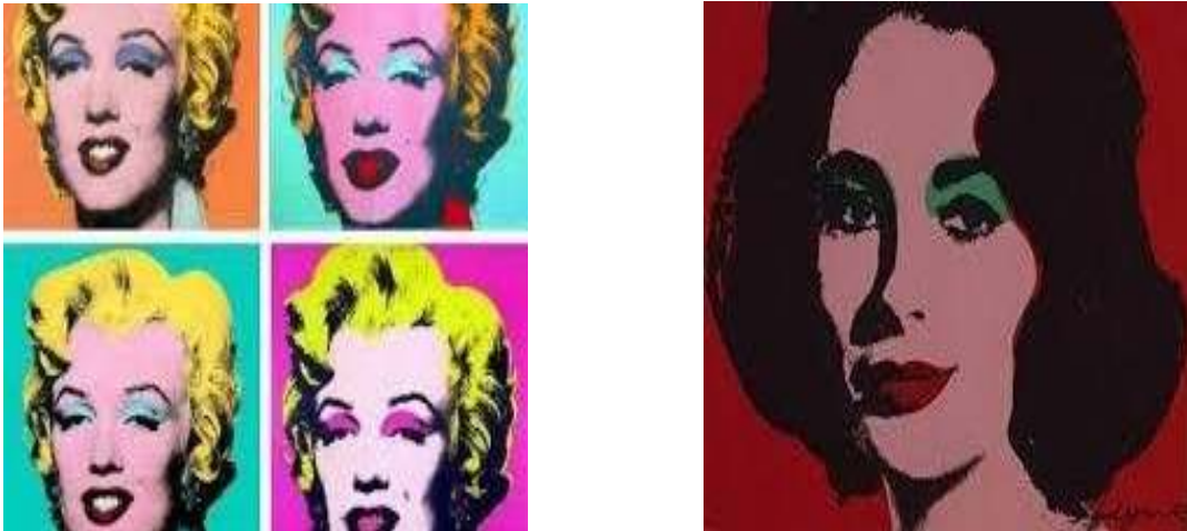
Obras de Andy Warhol serigrafías de POP ART

Xilografía: El dibujo se transfiere a un bloque de madera. Las áreas en blanco se vacían, de manera que el dibujo queda en relieve. por ello, en la lámina grabada o estampada, los trazos serán negros, y las partes vaciadas, blancas.