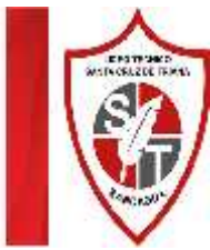
Liceo Técnico Santa Cruz de Triana "Diseñando Sueños, Construyendo Futuro"