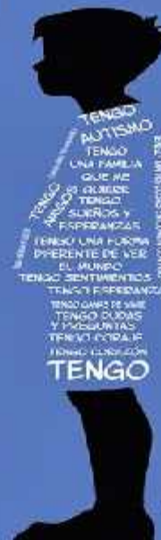
Ilustración Santiago Oyarzun