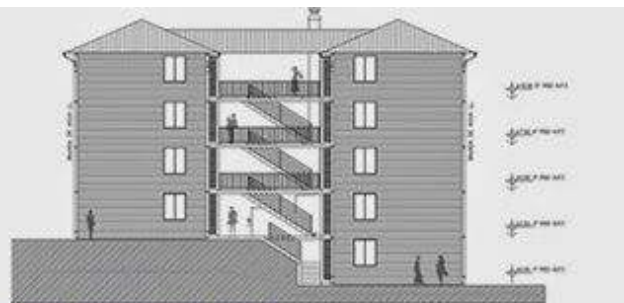
ELEVACIÓN SUR EDIFICIO TIPO A Y B